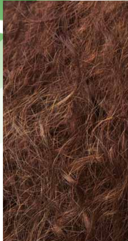
PRIMA DEL TRATTAMENTO Capello crespo e secco, opaco, difficile da pettinare. Scarsa tenuta della piega e del colore cosmetico.