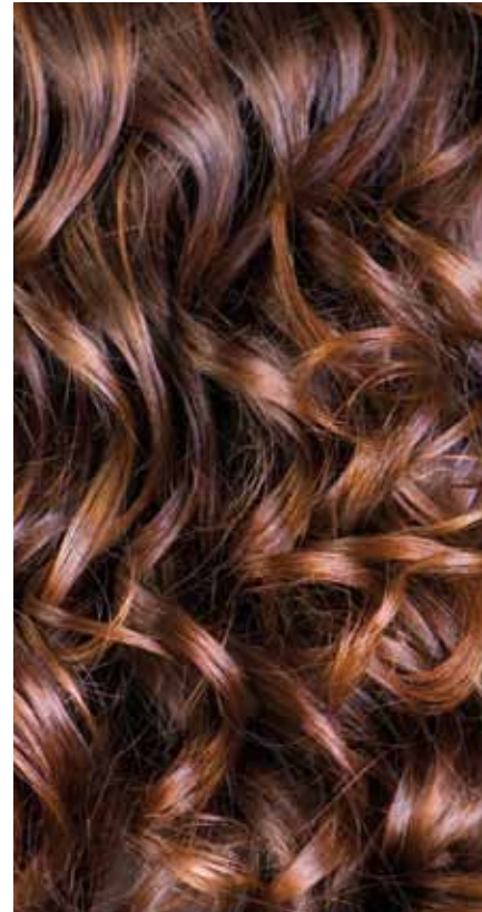
DOPO IL TRATTAMENTO Capelli morbidi ed idratati, ricci definiti ed elastici. Colore impeccabile.