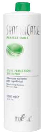
CURL PERFECTION SHAMPOO