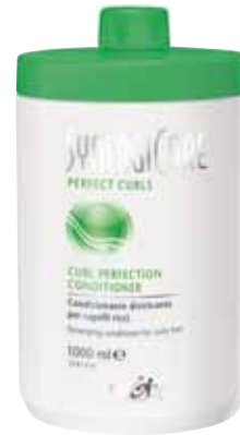
CURL PERFECTION CONDITIONER